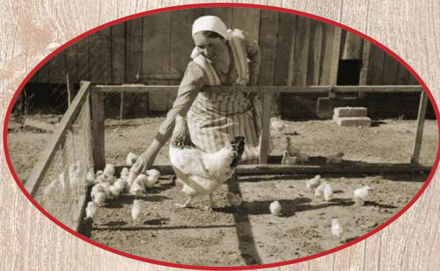
Eine Bäuerin füttert ihre Hühnerküken (Aufnahme vermutlich aus den 1930er Jahren)

Eier und Fleisch werden zusammen genutzt und verkauft.