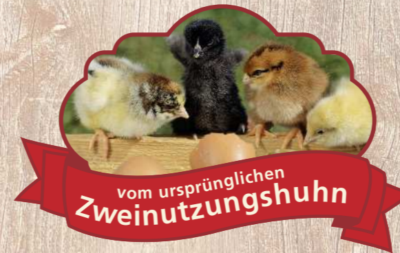
Unsere „Coffee & Cream Küken“ als Fotomodelle auf den Biohennen-Bio-Eiern

Ein Zweinutzungshuhn und kein Hochleistungshuhn, bei dem die Henne zwar weniger, aber dennoch genug Eier legt und der Hahn ausreichend Fleisch ansetzt. So wie es früher einmal war. Und so gehören Henne und Hahn endlich wieder zusammen.