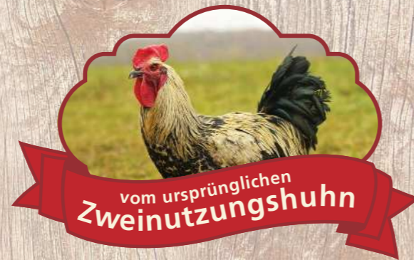
Unser Hahn „Peterle“ als Fotomodell auf den Biohennen-Gockelprodukten

Wir haben eine ethisch vertretbare und ganzheitliche Lösung im ursprünglichen Zweinutzungshuhn gefunden.